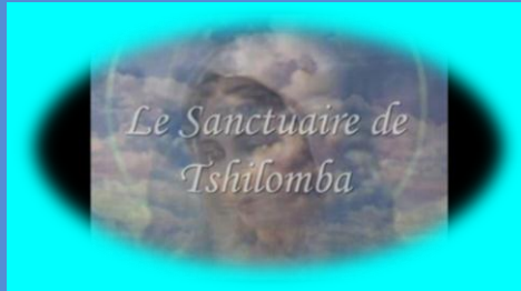
Le Sanctuaire de Tshilomba